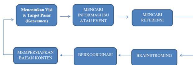
Gambar 1. Langkah-langkah Humas PDAM Tirtawening pemilihan konten di media sosial Instagram @perumda_tirtawening