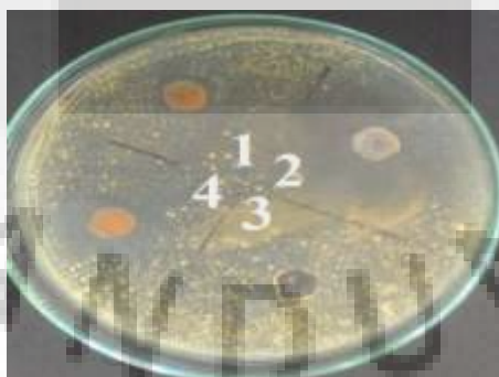
Gambar 1. Hasil pengujian aktivitas antifungi air perasan umbi wortel terhadap Candida albicans ATCC 10231

Dari Tabel V.5 diatas diketahui bahwa air perasan umbi wortel memiliki aktivitas antifungi terhadap Candida albicans ATCC 10231 ditandai dengan terbentuknya diameter hambat pada konsentrasi 25%, 37,5%, 50%, 75%, dan 100%. Sedangkan pada konsentrasi 5% - 24% tidak memiliki diameter hambat, hal ini dikarenakan pada konsentrasi tersebut air perasan umbi wortel tidak dapat menghambat fungsi dengan maksimal. Pada konsentrasi terkecil 25% memiliki diameter hambat sebesar 0,93 cm, sedangkan pada konsentrasi terbesar 100% memiliki diameter hambat sebesar 1,32 cm. Hal ini menunjukkan bahwa semakin besar konsentrasi air perasan umbi wortel, maka akan semakin besar diameter hambat yang dihasilkan. Hasil pengujian aktivitas antifungi air perasan umbi wortel terhadap Candida albicans ATCC 10231 dapat dilihat pada Gambar V.1.