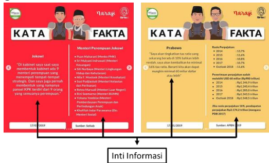
Gambar 5. Aspek informasi pada infografis Instagram @tirtoid

Aspek ketiga yaitu aspek informasi, aspek ini dapat membantu responden untuk memahami isi dari infografis Instagram @tirtoid tentang Debat Pilpres 2019 karena memberikan fakta-fakta dan inti informasi secara langsung sehingga memudahkan responden dalam memahami informasi dalam Debat Pilpres 2019 seperti pada gambar 5.