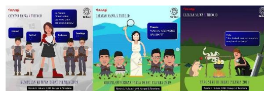
Gambar 1. Infografis Instagram @tirtoid bertema Debat Pilpres 2019

Infografis sendiri banyak dikatakan sebagai media atau saluran informasi yang cukup efektif dalam menyampaikan informasi terhadap khalayak karena menyajikan inti informasi yang mudah dicerna dan penyajian data menggunakan visual yang dapat menarik minat untuk membaca. Seperti beberapa infografis di akun Instagram @tirtoid yang bertema mengenai Debat Pilpres 2019 ini