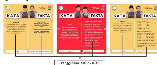
Gambar 4. Aspek konten pada infografis Instagram @tirtoid tentang Debat Pilpres 2019

Begitupun dengan aspek konten yang diukur menggunakan indikator kronologis waktu dan statistik. Aspek konten membantu responden untuk memahami isi dari infografis. Contoh infografis mengenai aspek konten seperti pada gambar 4.