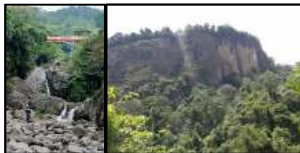
Gambar 1. Sebaran Bahan Galian Batu Andesit

Kegiatan penelitian bertujuan untuk menganalisis faktor - faktor yang berkaitan dengan menggunakan metode skor berdasarkan satuan genetika wilayah (SGW) yang kemudian dilanjutkan sesuai dengan langkah dalam penelitian yaitu dedukto - hipotetiko - verifikatif (Hirnawan, F, 2005).