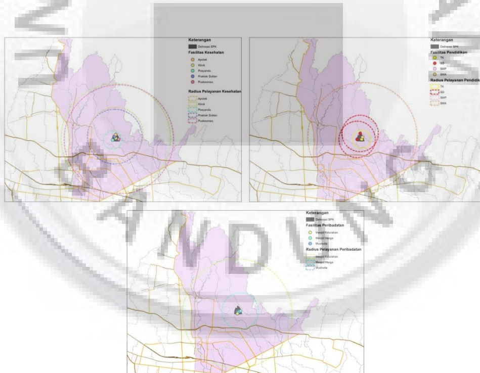
Keterangan: (dari kiri ke kanan), 1. Radius Pelayanan Fasilitas Kesehatan SPK Sadang Serang; 2. Radius Pelayanan Fasilitas Pendidikan SPK Sadang Serang; 3. Radius Pelayanan Fasilitas Peribadatan SPK Sadang Serang;